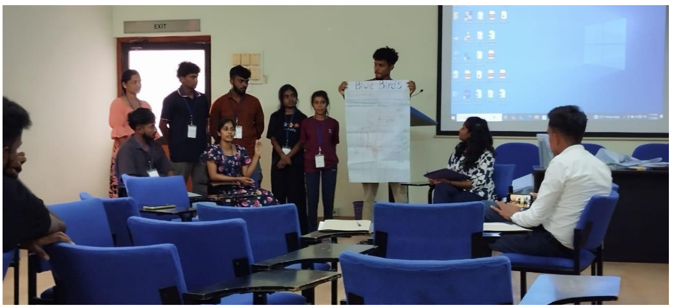
Role-plays and Presentations

- Preventive Education and Training Division of National Dangerous Drugs Control Board.